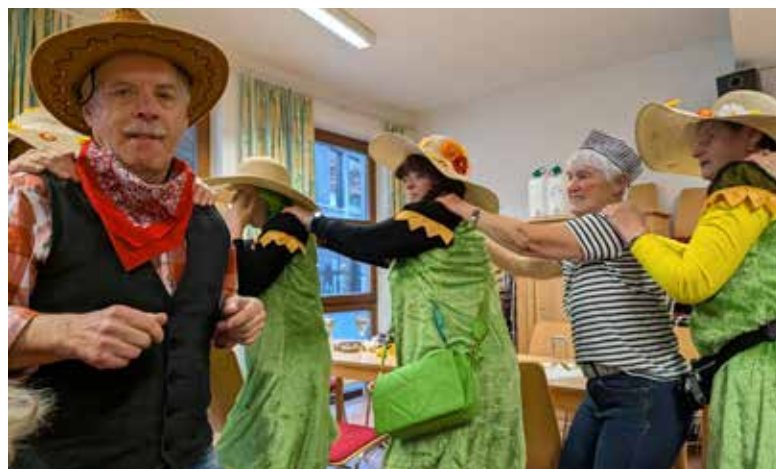
Närrischen Treiben am Unsinnigen in Breitenbach

Am Unsinnigen Donnerstag trafen sich die Breitenbacher Seniorinnen und Senioren zum traditionellen Fasching im Gemeinschaftsgebäude. Viele Närrinnen und Narren erschienen in kreativen Kostümen und sorgten für beste Stimmung. Ein besonderer Höhepunkt war der Auftritt der Maschgerer Gruppen aus Breitenbach und Kundl. DJ Reini heizte mit passender Musik ein, sodass gemeinsam getanzt und viel gelacht wurde. Die Ortsgruppe spendierte Kaffee und Faschingskrapfen für alle Gäste. Ein herzliches Dankeschön gilt allen, die bei Organisation und Durchführung mitgewirkt haben. Der Faschingsnachmittag war ein voller Erfolg und zeigte, wie wichtig solche gemeinsamen, fröhlichen Stunden für Lebensfreude und Wohlbefinden sind.