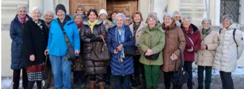
Die „Krippenschauer“ vor der Pfarrkirche Götzens