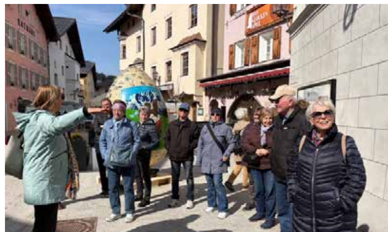
Bei der Stadtführung in der Gamsstadt