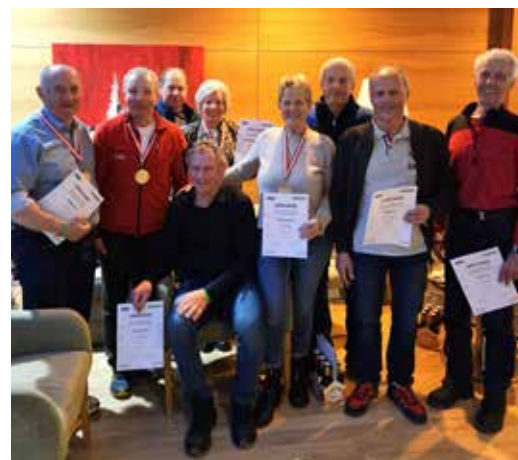
Schöne Erfolge unserer Tiroler Sportler