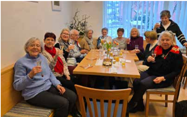
Die Stuben in Innsbruck erfreuen sich großer Beliebtheit!