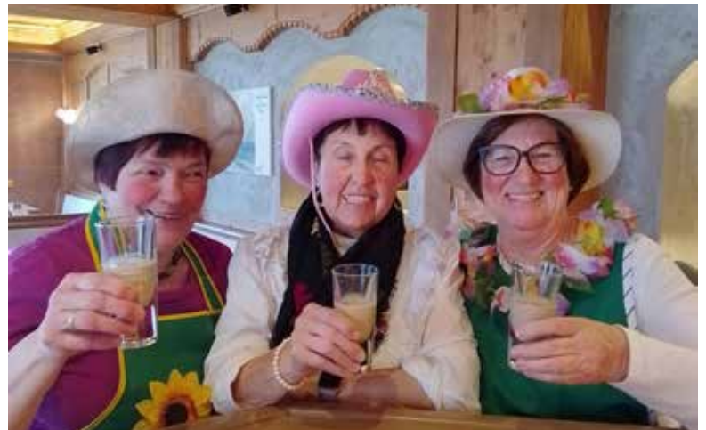
Gute Unterhaltung bei der OG Hippach