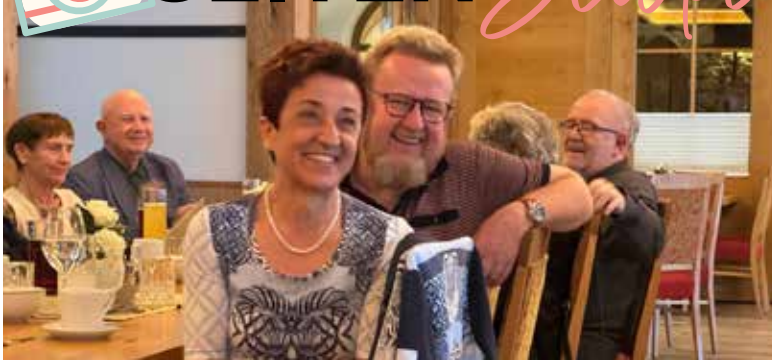
Beste Stimmung in der OG Strass i.Z.