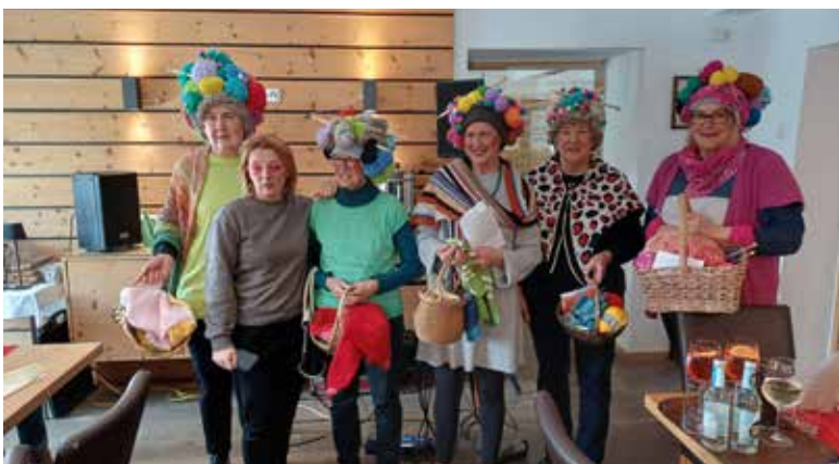
Feierstunde in der OG Abfaltersbach