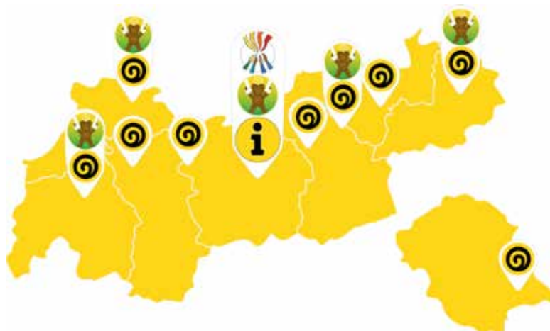
Beratungsstellen in Tirol