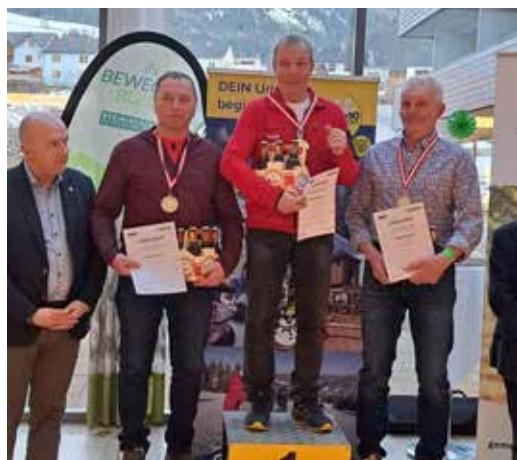
1. Platz Johann Angerer