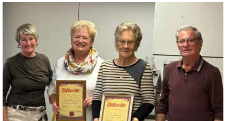
Immer was los in der OG Schönwies