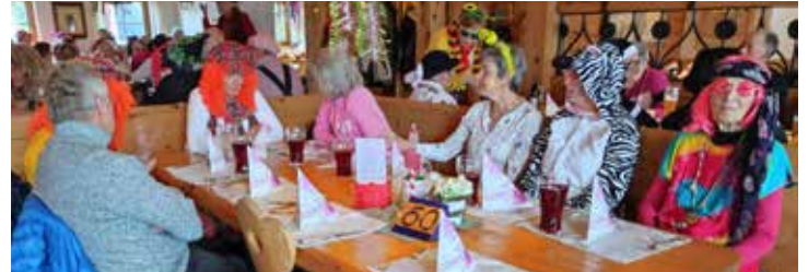
Im vollen Lokal der Kaiseralm am Campingplatz Euro-Camp herrschte bei den Besucherinnen und Besuchern beste Stimmung am Rosenmontag bei der Senioren-Faschings-Gaudi.

Mit mehreren Wanderungen, einer Faschingsveranstaltung am Rosenmontag, einem gemütlichen Nachmittag anlässlich des Josefittages sowie mehreren Spielenachmittagen sind wir voll in das neue Jahr gestartet. Neben einem Halbtages- und Ganztagesausfluges (nach Bayern und Osttirol) ist der nächste wichtigste Termin die Jahreshauptversammlung mit Neuwahlen und Ehrungen am 22. Mai 2026 um 11:30 Uhr (beginnend mit einem Mittagessen) der nächste wichtigste Programmpunkt im ersten Halbjahr.