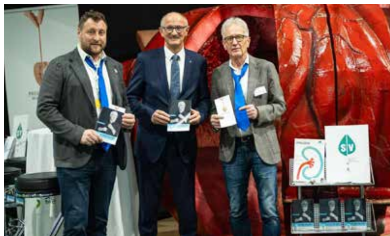
Frühlingsmesse: Informationsstand mit Prostatamodell

Krebstherapien sind in der Regel „multimodal“, das bedeutet die Integration verschiedener Therapieformen. Als Beispiele dieser Therapien seien die chirurgische Entfernung eines Tumors, die Bestrahlung und die Systemtherapien genannt. Hierbei hat sich vor allem neben der klassischen Chemotherapie die gezielte Therapie und auch die Immuntherapie gegen Krebs enorm entwickelt. In Zukunft werden sich die Arten der Immuntherapien voraussichtlich immer weiterentwickeln. Um Entwicklungen voranzutreiben und neueste Therapien zu ermöglichen, werden klinische Studien durchgeführt. An Hand der klinischen Studien verbessern sich die Heilungschancen stetig. Es ist von essentieller Bedeutung, dass die optimale Therapiestrategie für Betroffene immer interdisziplinär unter Einbeziehung aller wichtigen Fachbereiche in sogenannten Tumorboards getroffen wird. Von zentraler Bedeutung ist in dieser schwierigen Zeit aber auch die psychonkologische Beratung, die den Patientinnen und Patienten sowie deren Angehörigen hilft, mit der Situation besser umzugehen und diese kontinuierlich zu begleiten.