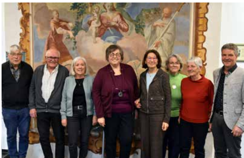
Jahreshauptversammlung mit Neuwahlen