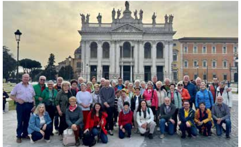
Unsere Landesreise in die Ewige Stadt