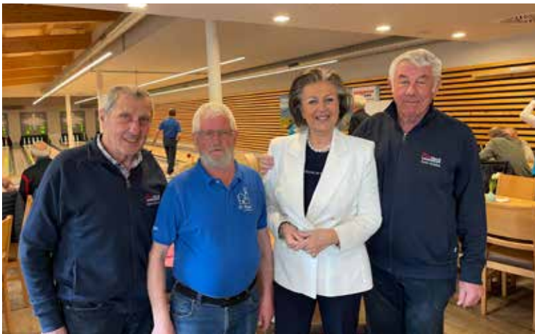
Bezirkskegeln Kitzbühel in Hopfgarten