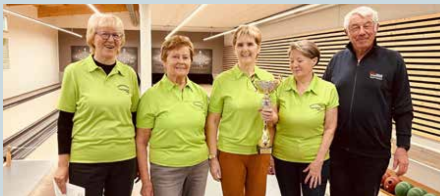
Siegerinnen Hopfgarten Damen 1