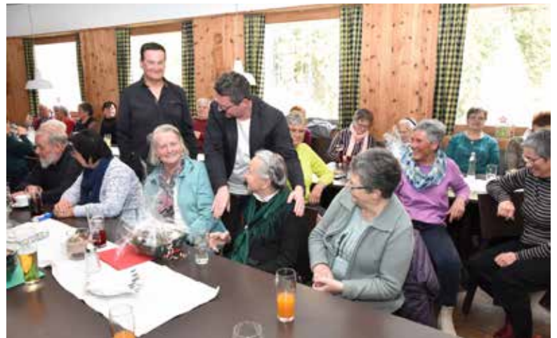
Ehrungen in der aktiven OG Kals