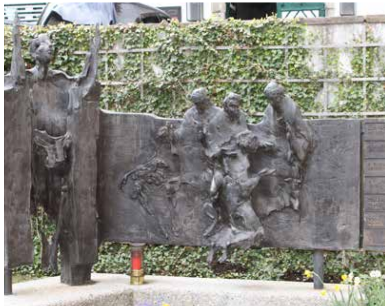
Priestergrab in Seefeld

Für Tiroler Auftraggeber schuf er zahlreiche Skulpturen: Die Großplastik am Südportal des Felbertauerntunnels in Osttirol