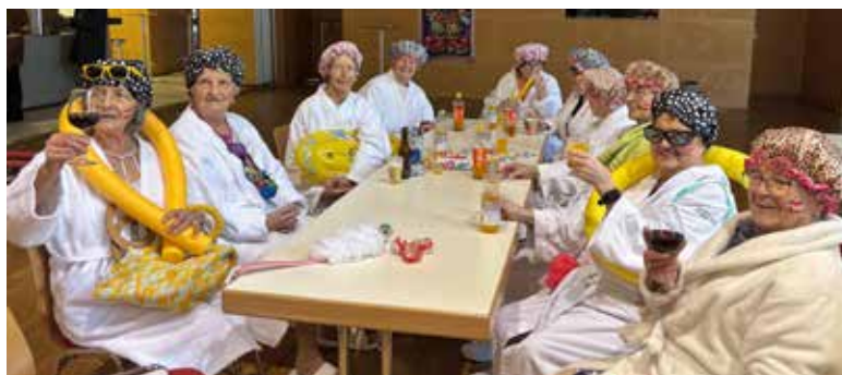
Die Badenixen von Galtür

Beim heurigen Faschingsumzug beteiligten sich die Frauen der Senioren-Kartnergruppe als „Badenixen“. Leider ist der Obmann, den sie als Bademeister angeheuerten hatten, krankheitshalber ausgefallen. Die Gruppe erntete großen Beifall und wurde sogar vom Herrn Bürgermeister zu „Kuchen und Kaffee“ in einem unserer Gasthäuser eingeladen. Juen Georg sen.