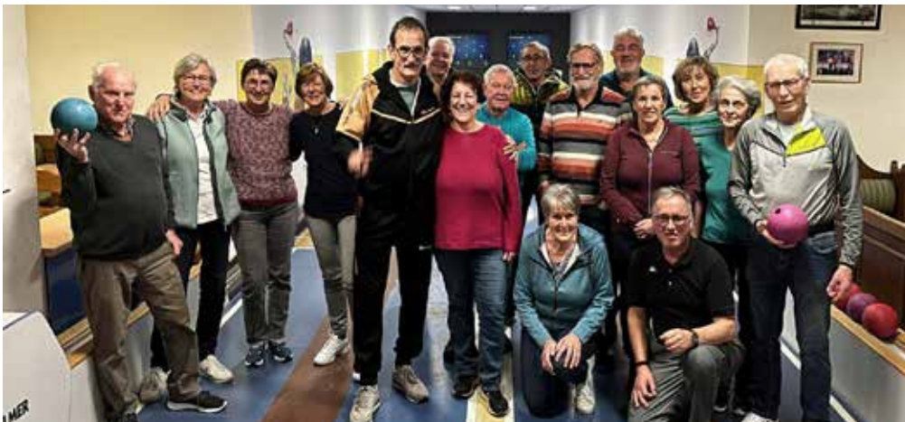
Erstes Training mit zwei Geburtstagsjubilaren